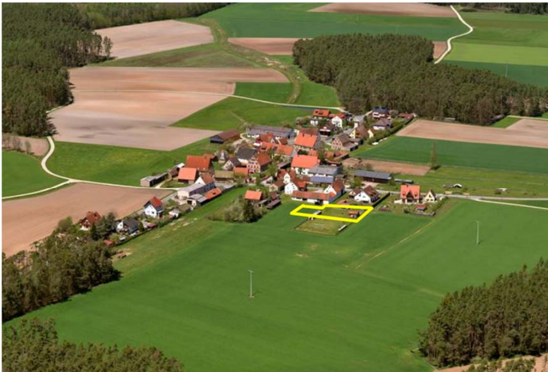
Abs.: 3: Das Dorf Asbach, Luftaufnahme von Südosten

Eine Beeinträchtigung hinsichtlich Freizeit und Erholung sind zwar keine Wander- oder Radwege in unmittelbarer Nähe vorhanden, die Straßen und Wege in diesem Bereich sind aber allgemein für die Bezüge zwischen Dorf und Landschaft und die siedlungsnahe Erholung wichtig.